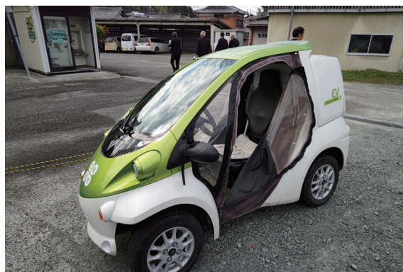
小水力発電等を活用して動く 電気自動車「コムス」