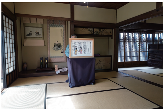
「立梅用水」の歴史を紙芝居にて学ぶ

歴史ある六ヶ郷用水をこれからも活用し続け、新たなことが出来るとすればそれは何か。皆様の知恵を頂きながら考えていきたいと思っています。