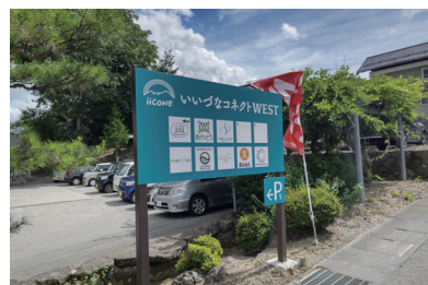
↑閉校した学校を再活用(飯綱町)