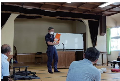
↑町総合防災訓練の後に 地元区でも防災勉強会開催