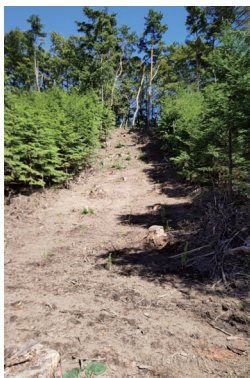
↑植樹祭開催。坂城小学校の児童と一緒に