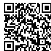
↑6月議会の会議録が お読みいただけます