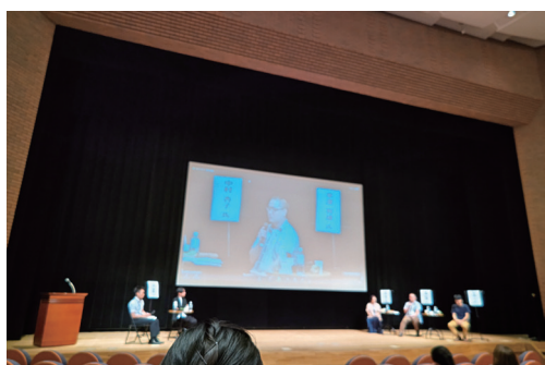
↑ひきこもり支援フォーラム(長野市)