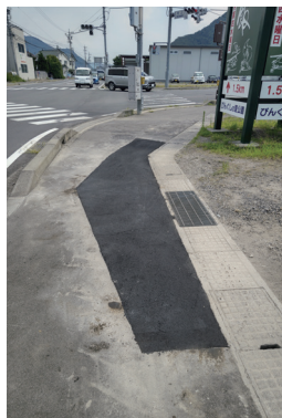
↑道路に陥没箇所発見 県に報告し対応してもらいました